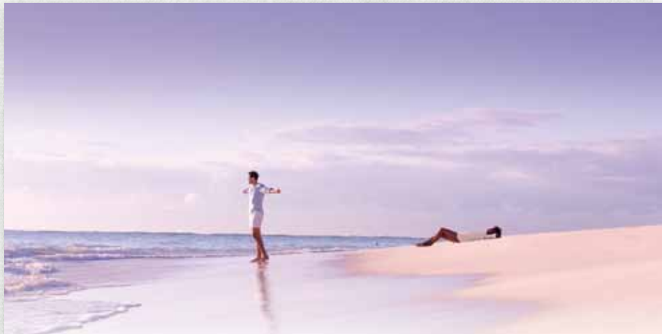
自分を解き放ち、自由を謳歌するひとときを。