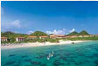
美しい海に囲まれた「クラブメッド・石垣島」。