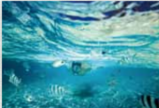
普段できないことにもチャレンジ。